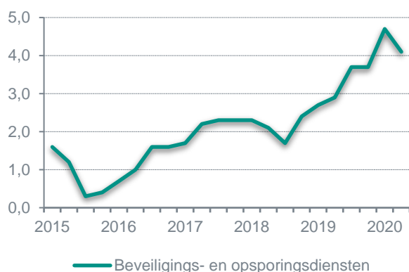
Figuur 3: Prijsontwikkeling beveiligings- en opsporingsdiensten, in projecten j-o-j

Toch heeft de uitbraak van het virus ook deze branche hard geraakt. In het tweede kwartaal van dit jaar daalde de omzet van deze branche met 3,4 procent. Doordat evenementen op grote schaal geen doorgang hebben gevonden, is een deel van de jaarmzet van de beveiligingssector voorgoed verloren. Door de onzekerheid over het verloop van het virus en de ontwikkeling van een vaccin is het momenteel de vraag in welke vorm en mate evenementen dit en volgend jaar terugkomen. Een